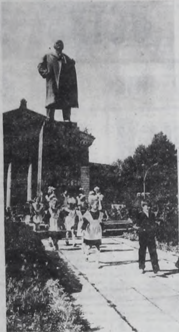
Город, в котором живем.