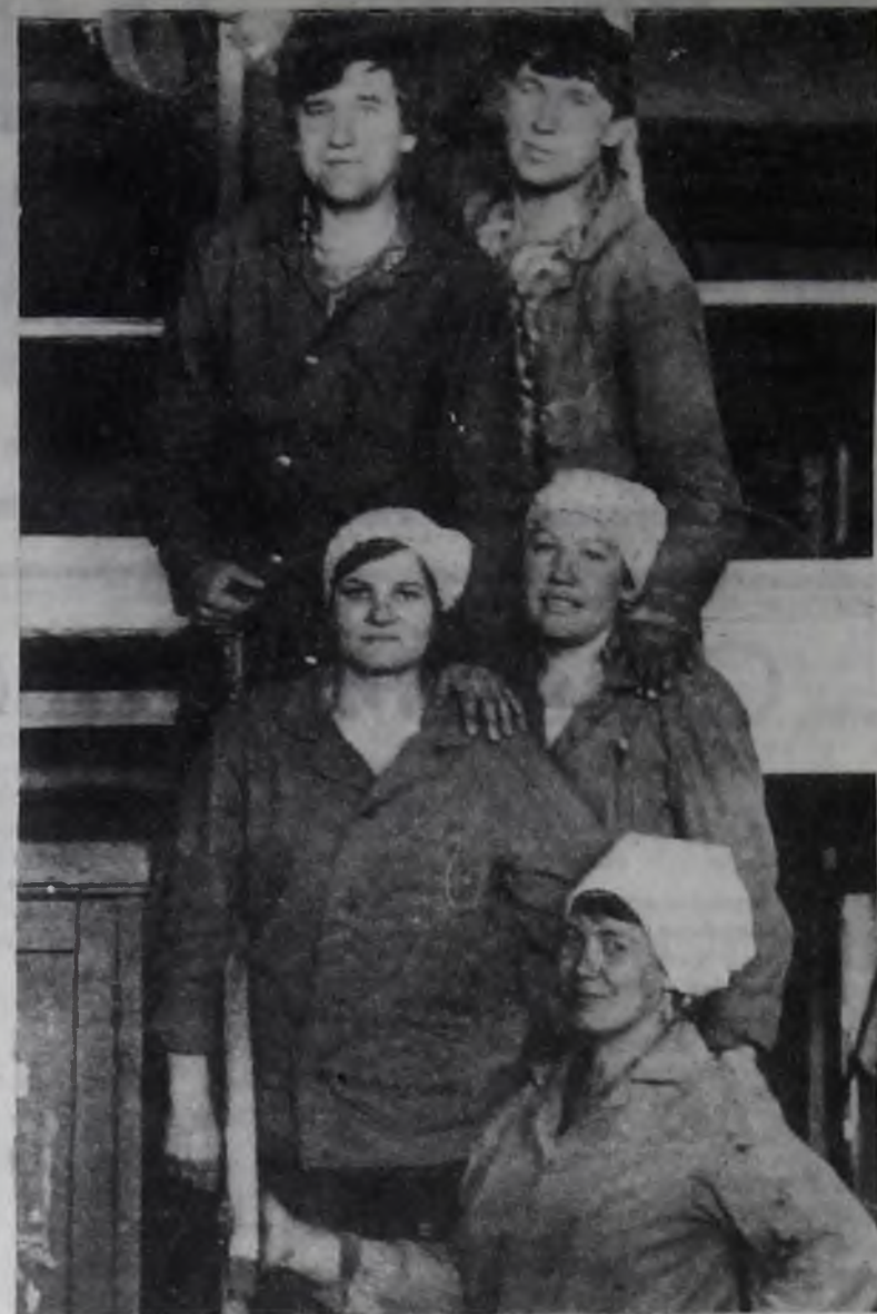
Коллектив установки 382 цеха 26-27 завода катализаторов и опытных установок носит звание «Лучший коллектив» и «Коллектив отличного качества». Члены пяти бригад, работающих на установке, трудятся на «отлично».