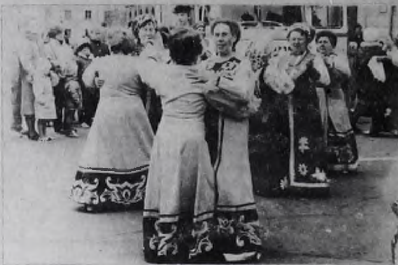
© Художественная самодеятельность ДК нефтехимиков. Фото И. АМОСОВА.

Работает театр кукол «Буратино», спектакль «Репка» — 11, 13. 10 ноября Киноклуб в гостях у сказки, кинофильм «Морозко» — 12.00. Дискотека — 18.00.