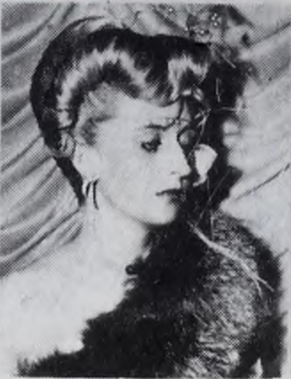
свежими и привлекательными.