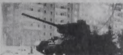
ко дней. Немцам, видимо, на- доела наша пристрелка.

подвиг этого мальчика, Приземлился на газоне и лежит он на спине... Видит папу на балконе, маму блаженную в окне.