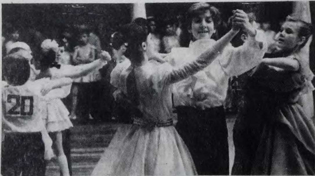
Молодость — лучшая пора человека.