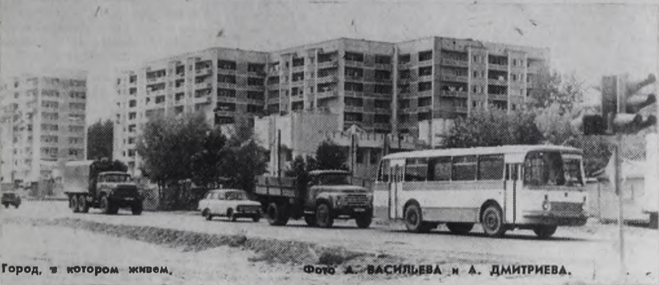
Город, в котором живем.