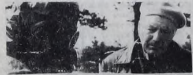
4 октября 1932 года Советское Правительство утвердило ПОЛОЖЕНИЕ о МПВО. Этот документ определяет формирование команд по за-

щита населения, обучению, подготовке руководящего состава и пропаганде знаний противовоздушной обороны.