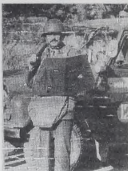
Эти спецсредства у нас имеются.

— Приходилось ли за последнее время применять спецсредства в Ангарске!