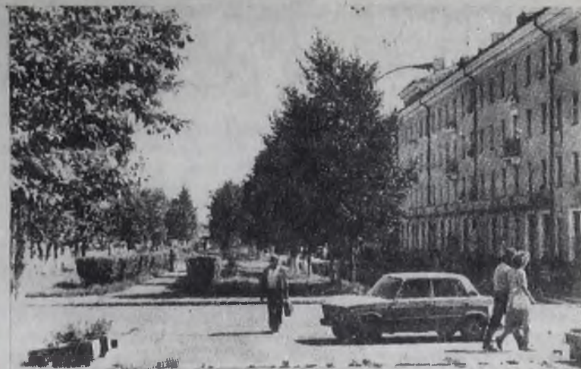
На улицах Ангарска.