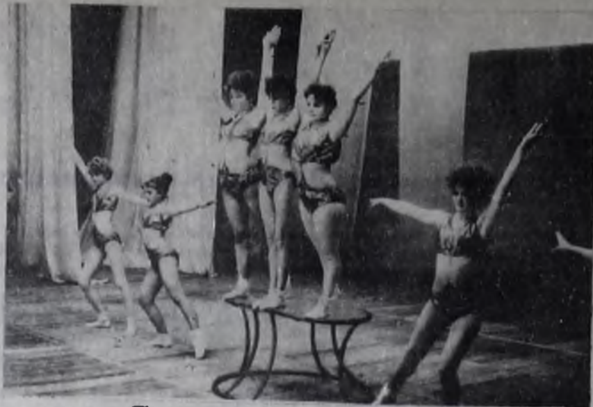
Спорт и искусство