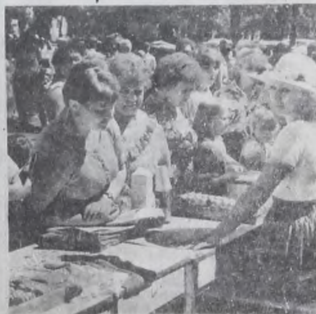
НАВСТРЕЧУ ВСЕМИРНОМУ ФЕСТИВАЛЮ МОДЕЛИ И СТУДЕНТОВ