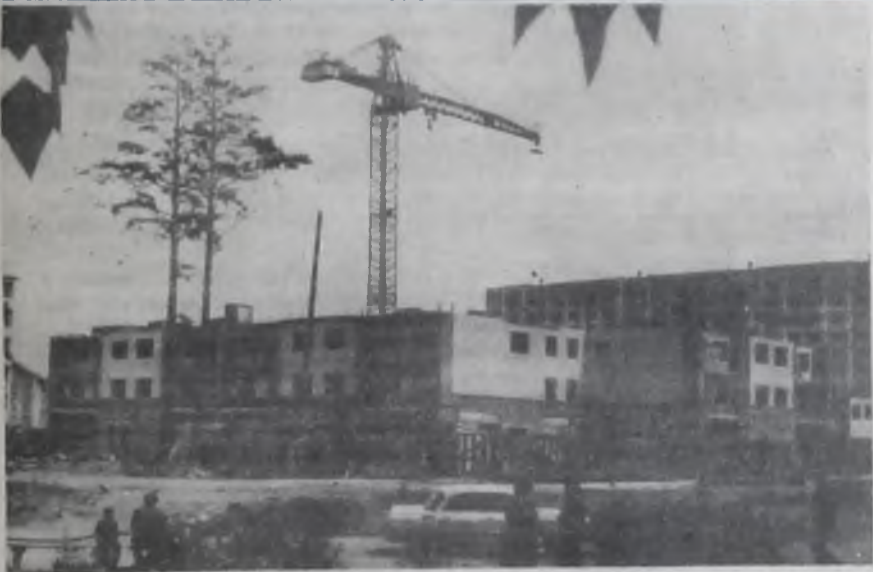
Ангарск и ангарчане.