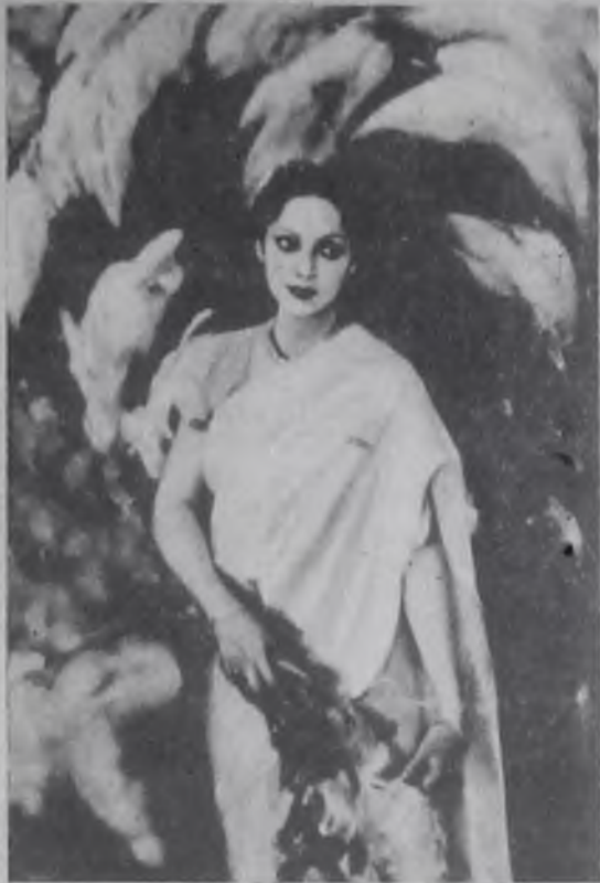
Особенно запоминается живописный портрет Ярослава Мудрого.

На выставке этот период творчества представлен несколькими прекрасными по-