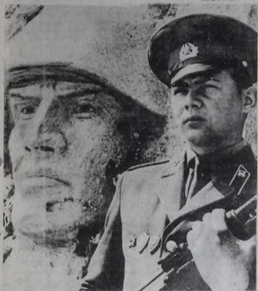
День рождения Советской Армии и Военно-Морского Флота