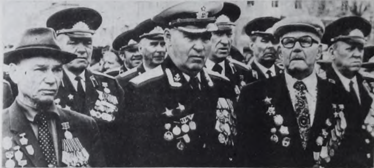
[9 мая 1988 г.]