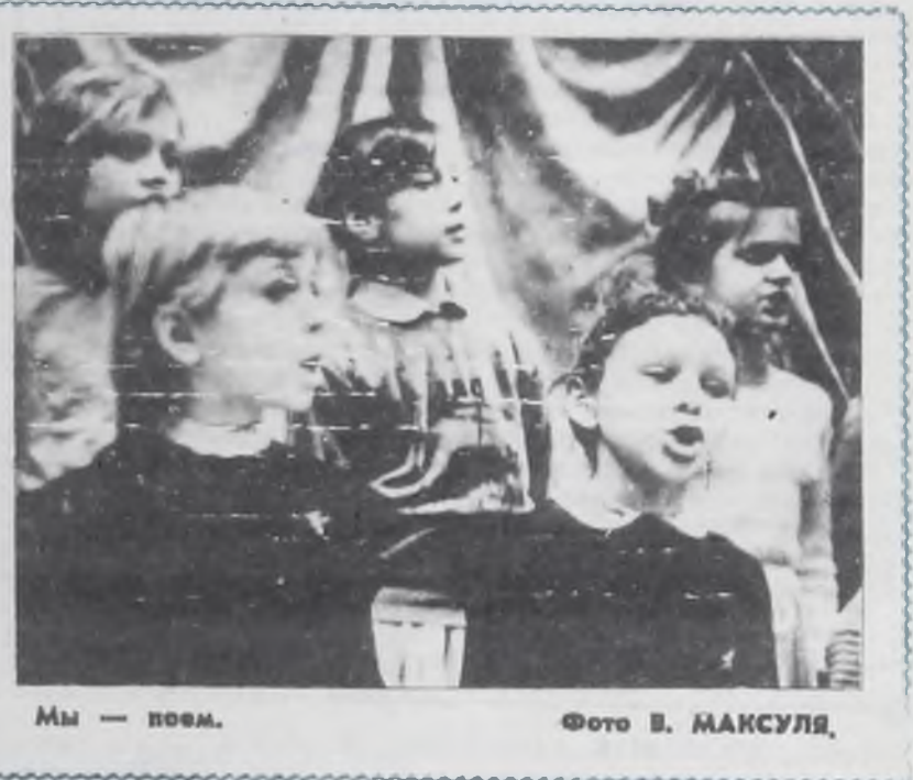
Мы — поем.