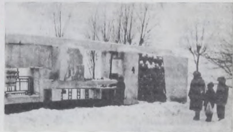
© У памятника. Фото Володи Воронова, ученика 7 класса школы № 3. © В лесу. Фото Алеша Гонтаренко, ученика 6 класса школы № 8.