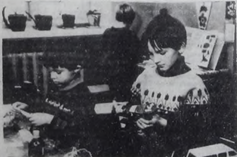
В кружке «Умелые руки».