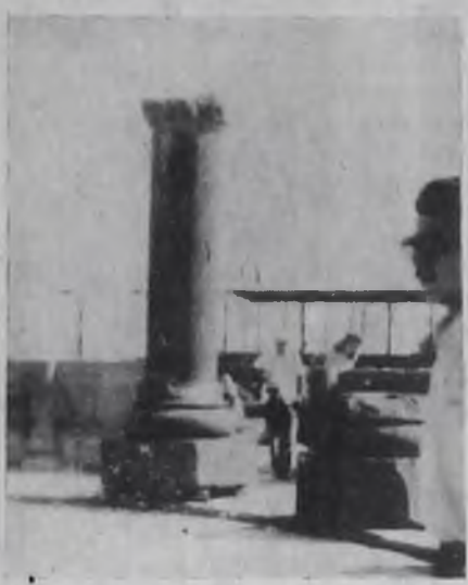
рез призму ее истории.

До трагедии 1914—1916 годов армянский народ населял всю территорию Армянского нагорья, но после чудовищной резни и депортации армян, уцелела лишь та часть исторической Армении, в которой 29 ноября 1920 года была провозглашена Советская власть.