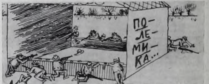
К вопросу о полемике...