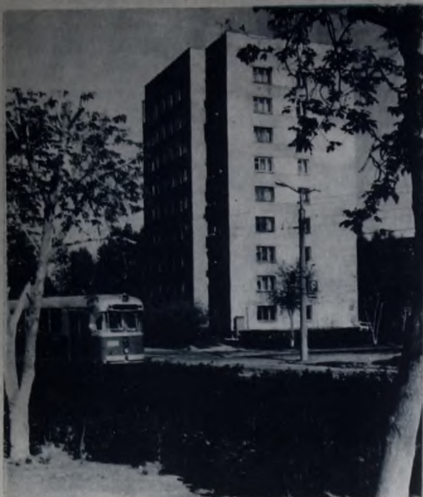
Город, в котором живем.