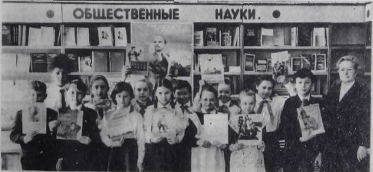
На празднике книги в магазине «Тимур».

Живут еще на свете кустари, у них еще в почете труд кустарный. Пред ними от зари и до зари — крутой резец или тот же круг гончарный. И, как в века минувшие, как встарь, сидят, у ночи не прося отсрочки. Любый кустарь — он был и есть кустарь. И я кустарь, когда шлифую строчки.