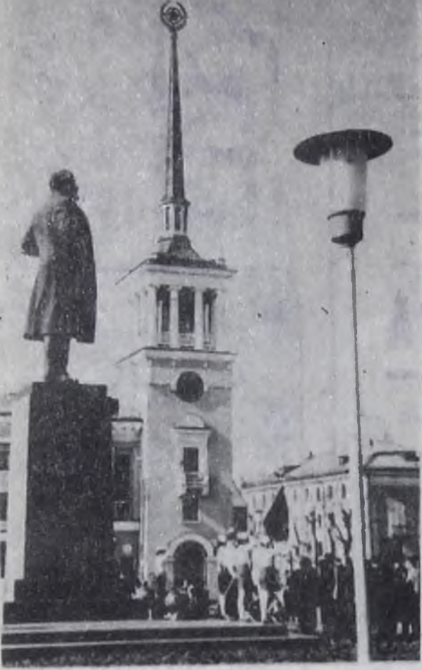
Ангарск. Площадь Ленина.