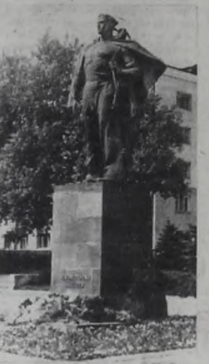
© Новороссийск. © Неизвестному матросу.

А. ГОРДИЕНКО, приборист НПЗ, ветеран Тихоокеанского флота.