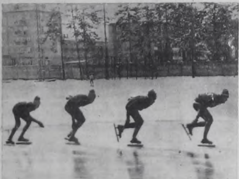
В воскресный, зимний день.