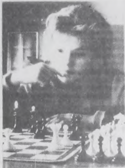
— Вам мат, маэстро! —