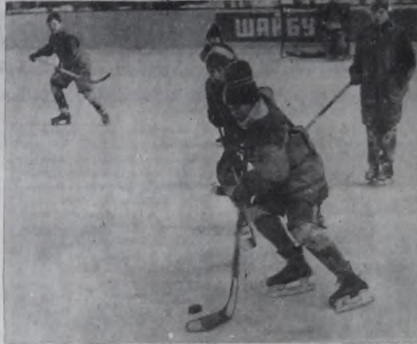
Шайба в игре!