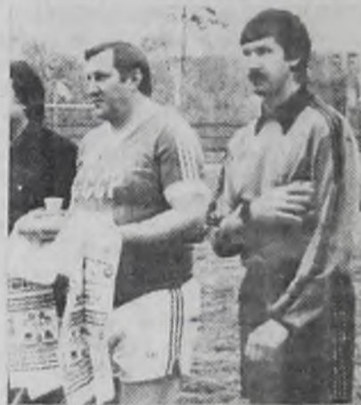
Со счетом 4:1 в пользу именитых гостей матч был закончен под аплодисменты болельщиков.

Главными в этой встрече, конечно же, были не результат, не голы, не потерянные возможности в игровых ситуациях, а сама возможность лицезреть, общаться и даже получить авто-