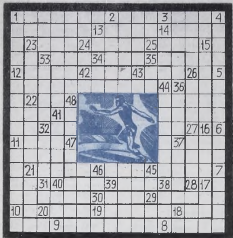
ЧАЙНВОРД «ФИЗКУЛЬТУРА И СПОРТ»