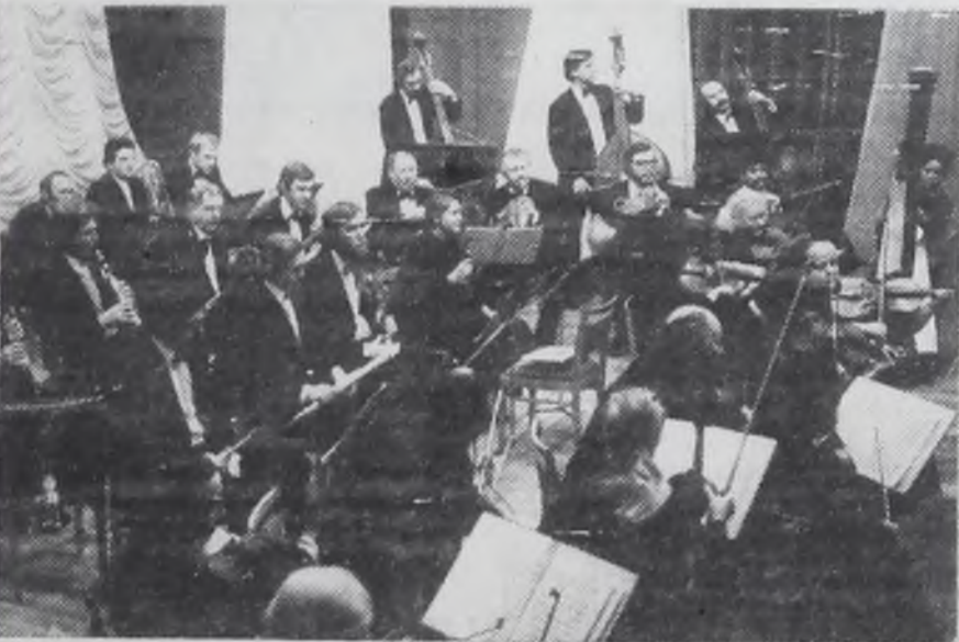
На снимках (вверху) — Братская ГЭС. — На полях Приангарья. — Иркутский симфонический в Ангарске.

6 мая сорок второго года от трудящихся Иркутской области в дар войнам передан