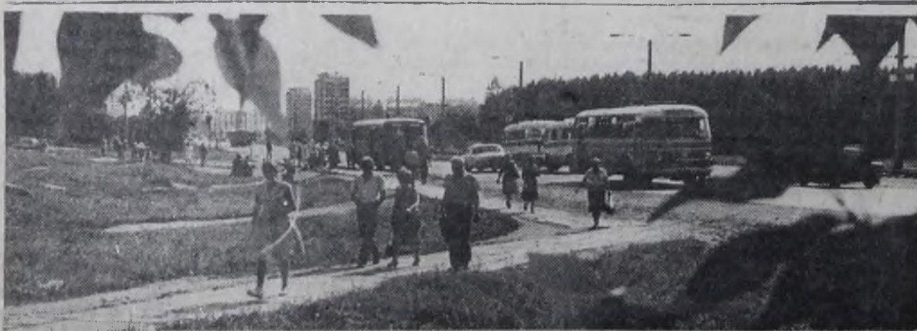
Город, в котором живем.

Да уж, что верно, то верно... И не только рано, но и неуместно. И. БРЮХАНОВ.