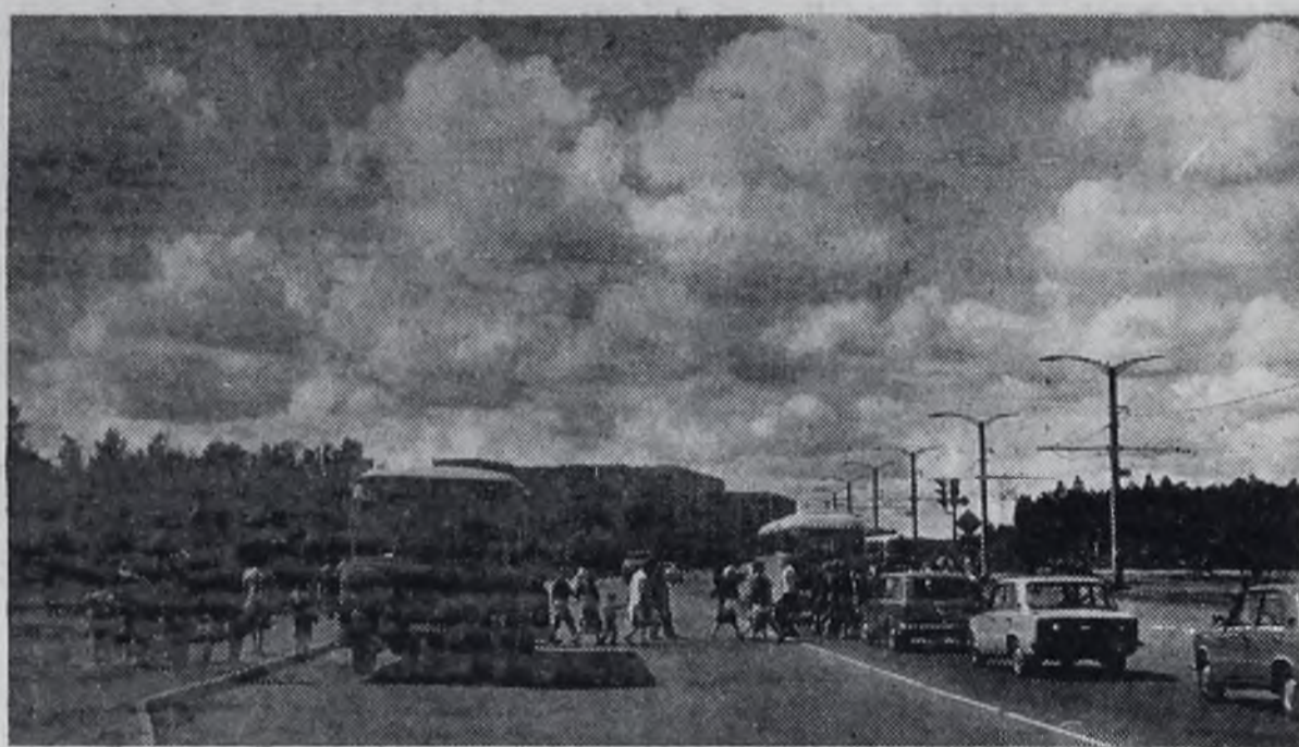
Ангарск. Юго-Западный район.