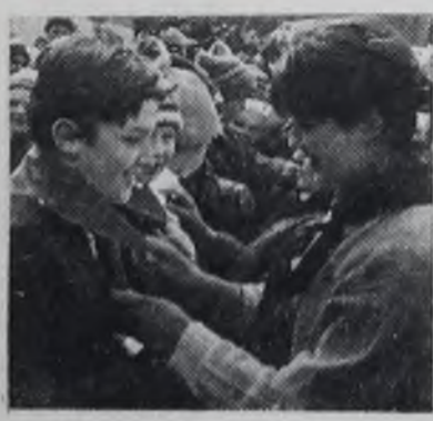
Ангарск. Площадь Ленина. 22 апреля 1987 года.