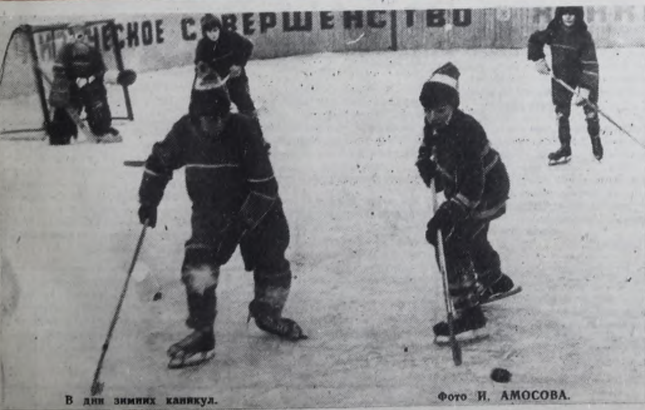
В дни зимних каникул.