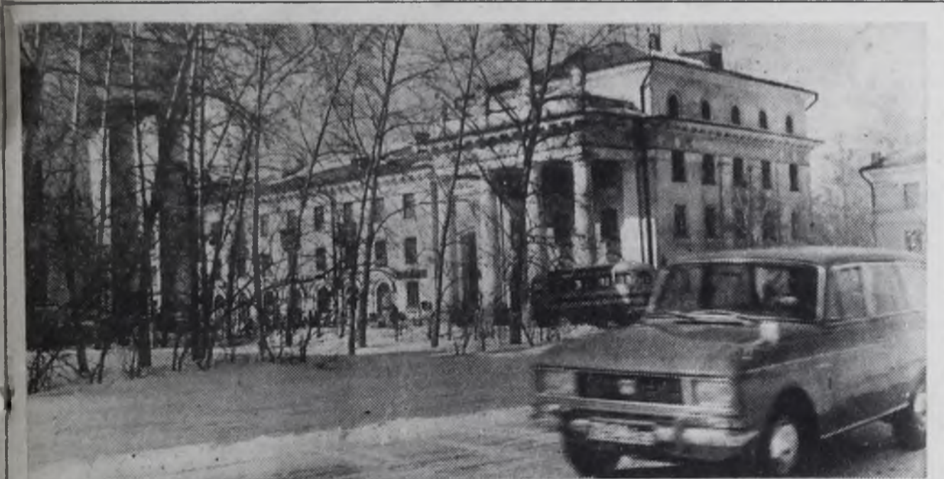
Город, в котором живем.