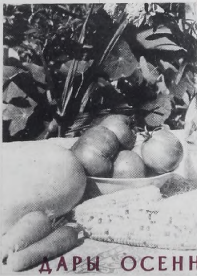
ДАРЫ ОСЕННЕЙ ПРИРОДЫ