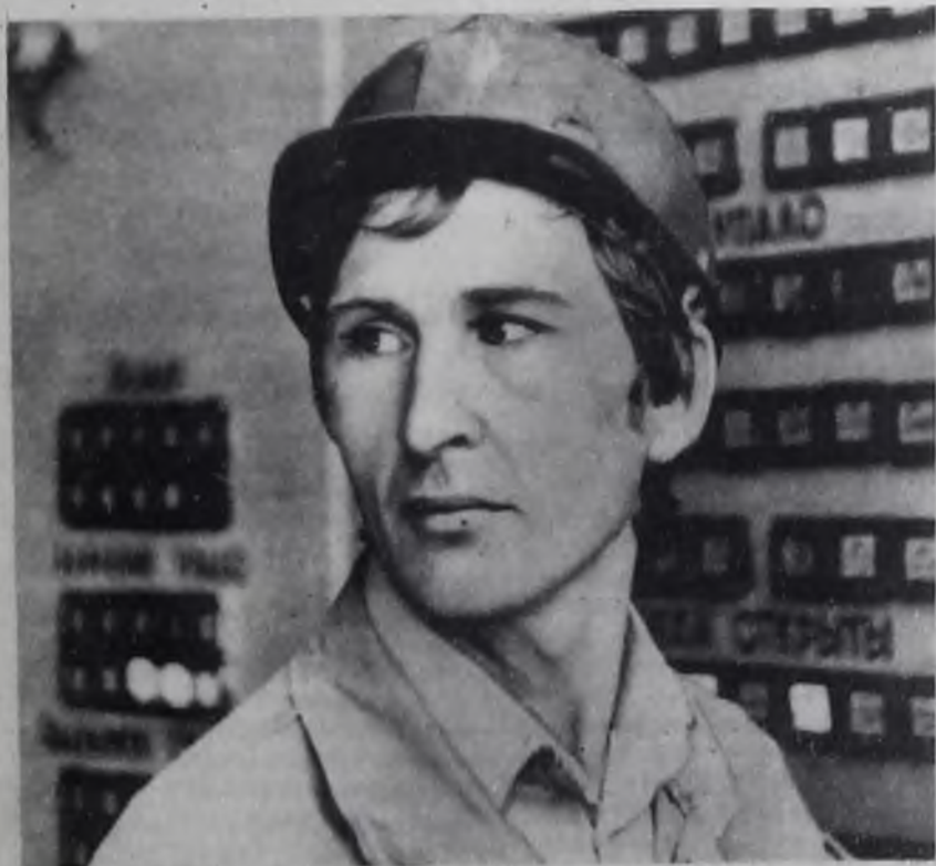
Коллектив ТЭЦ-9 — неоднократный победитель городского социалистического соревнования.

Необходимо в каждом трудовом коллективе в месячный срок пересмотреть условия социалистического соревнования, в основу организации соцсоревнования на предприятиях положить постановление ЦК КПСС, Совета Министров СССР, ВЦСПС и ЦК ВЛКСМ «О Всесоюзном социалистическом соревновании за успешное выполнение заданий 12-й пятилетки».