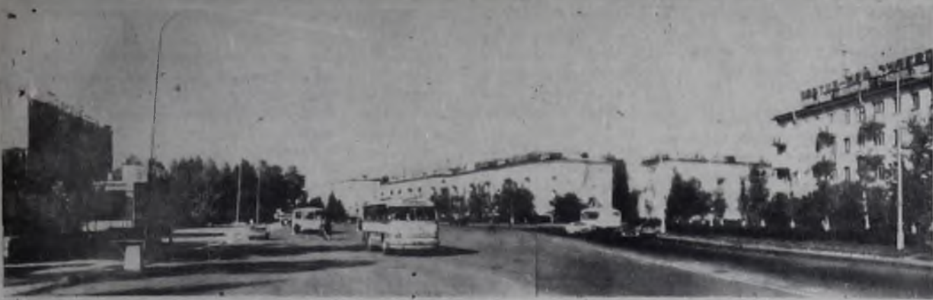
Ангарск. Улица Энгельса.