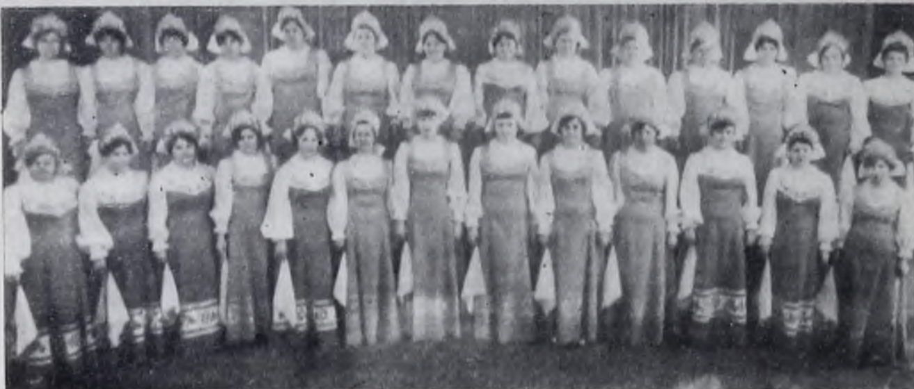
Хор русской песни швейной фабрики.