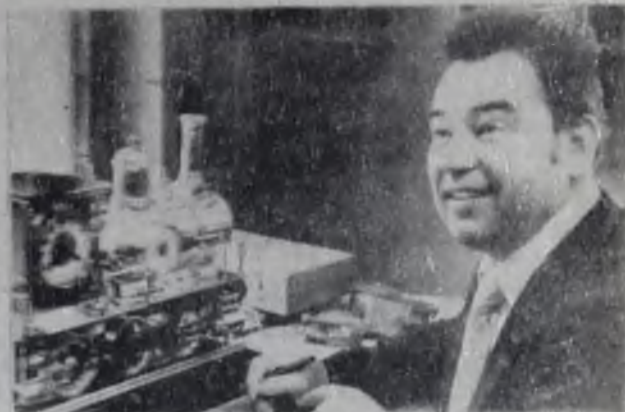
На снимке: почетный комсомолец Ангарска летчик-космонавт Г. М. Гречко в музее часов.

лась часами с паровоза. Снабженные скоростемером, внешне они скромны, но машинисту они необходимы.