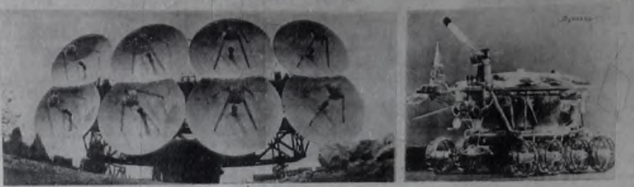
Начало на 1-й стр.

Волшебным в жизни города явилось награждение Ангарска орденом Трудового Красного Знамени. Указ об этом был опубликован в печати 18 января 1971 года.