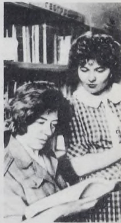
Двадцать одна тысяча шестьсот востоянных читателей записано в библиотеке профкома «Ангарсканефтеоргсинтез». Дипломанты ВЦСПС, почетными грамотами ЦК профсоюза, ЦК ВЛКСМ, облсовета награждены коллектив библиотеки нефтехимиков.

Пленум отметил, что по итогам минувшего года городская организация заняла первое место в области по всем показателям. Деятельность го-