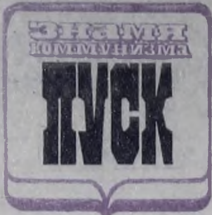
ЛИСТОК 3 (33)