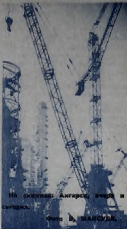
На стройках Ангарска, вчера и сегодня.