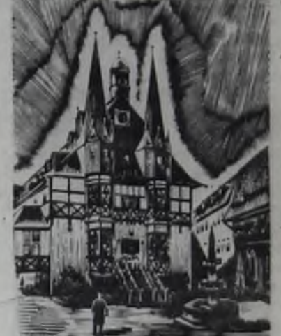
Уголок в городе Мейсене.

Датой основания Дрезденской картинной галереи считается 1722 год. История галереи продолжается сегодня и не иссякнет в будущем. Много написано о ней восторженных откликов, но самым памятным считается тот, который сделал молодой Гете, впервые посетивший галерею в 1768 году. «Час открытия галереи, ожидаемый с нетер-