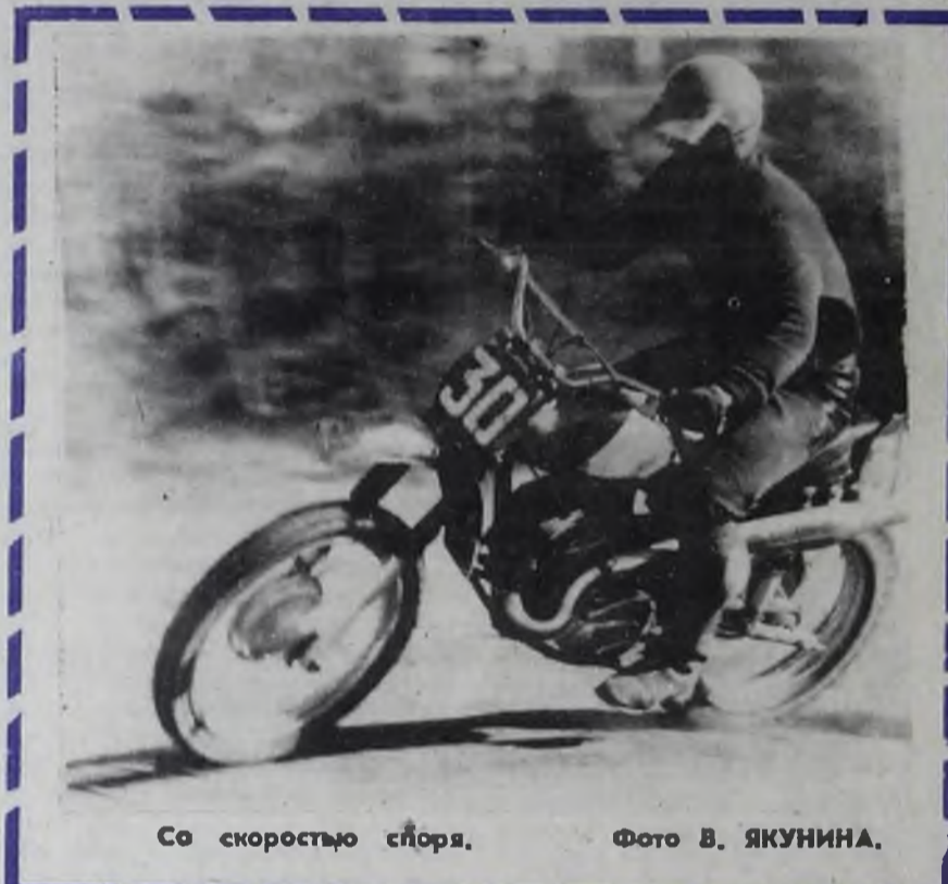
Со скоростью ветра.

15.20 — Программа телевидения Таджикской ССР. 17.00 — «Кинопанорама». 19.00 — «Здоровье». 19.45 — «Международное обозрение». 20.00 — «Эрмитаж». Фильм 21-й. 20.30 — «Спокойной ночи, малыши!». 20.45 — На V зимней Спартакнаде народов СССР. 21.15 — «Музыкальный кюск». 21.45 — «Рабочее общение». Телевизионный документальный фильм. 22.05 — «Время». 22.35 — Вечер поэзии Д. Кугультинова в Концертной студии Останкино.