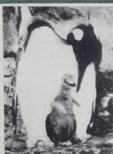
В МИРЕ ЖИВОТНЫХ

По представлениям тибетских врачей, главным условием сохранения здоровья человека является равновесие физиологических функций организма. «В живом теле все связано между собой» — это правило строго соблюдалось при установлении диагноза заболевания. Главный принцип лечения — «лечение противоложным». Средства лечения: