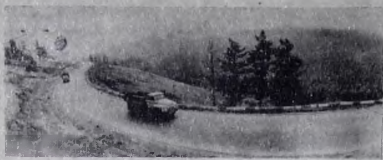
ФОТОАЛЬБОМ «ШИРОКА СТРАНА МОЯ...»

На снимке: важнейшая транспортная артерия Тувы Усинский тракт связывает Кызыл с Абаканом — столицей Хакасии.