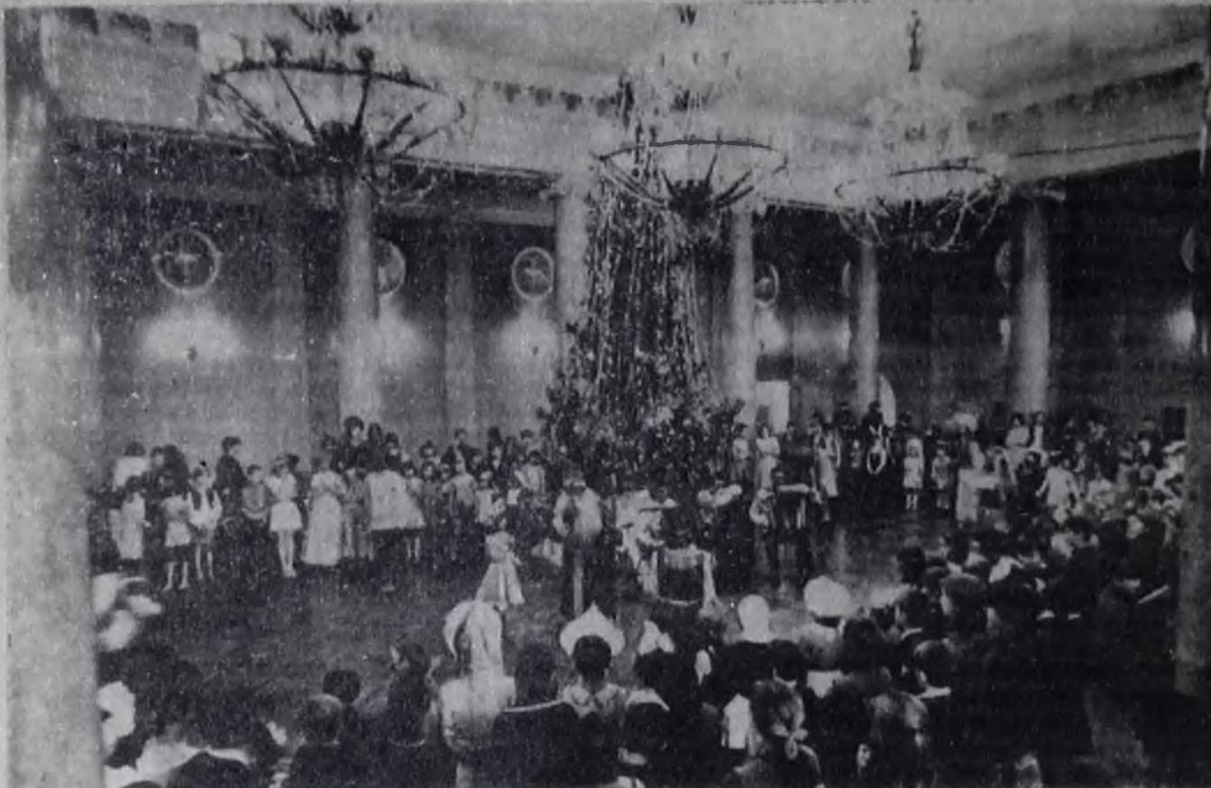
Новогодний карнавал в ДК нефтехимиков.