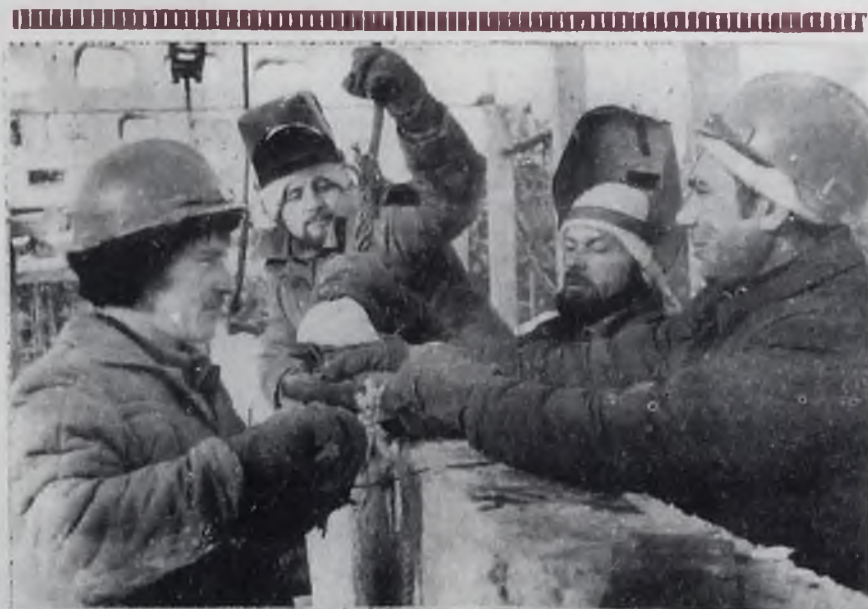
В АНГАРСКЕ возводятся крупные объекты, предназначенные для хранения сельскохозяйственной продукции: холодильник на 6000 тонн и начато строительство овощехранилища на 8000 тонн в 215-м квартале.

Окончательные итоги областного социалистического соревнования в честь 60-летия со дня образования СССР подводятся бюро обкома КПСС, исполкомом областного Совета народных депутатов, президиумом облсовпрофа и бюро обкома ВЛКСМ до 15 декабря 1982 года.