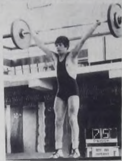
ды, занявшие второе и третье места, награждены дипломами и вымпелами.

Победители в каждой весовой категории были награждены грамотами, жетонами и памятными подарками, призеры — грамотами и жетонами. Команда-победительница награждена дипломом I-й степени, памятным вымпелом и переходящим призом. Коман-