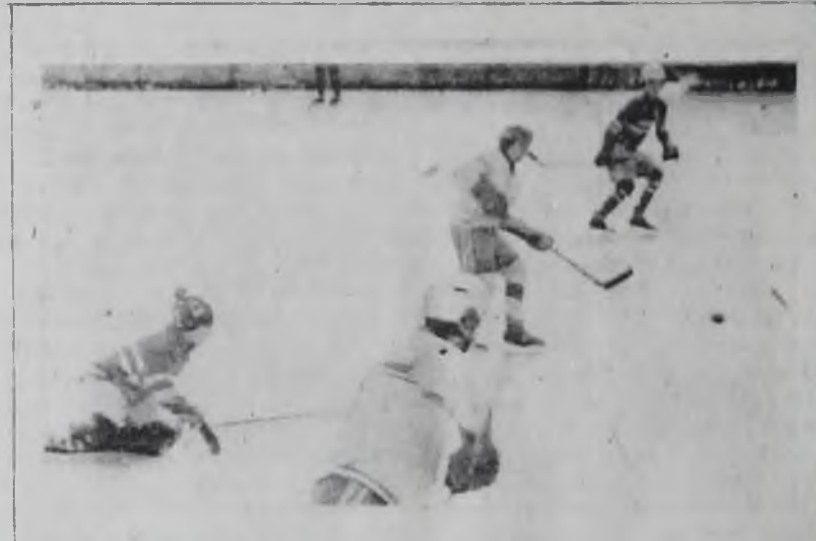
На приз клуба «Золотая шайба».

СЫГРАВ в Омске со счетом 1:4 и 4:4, «Ермак» завершил первый круг чемпионата, набрав 31 очко. В третьем сезоне за весь чемпионат команда сумела набрать 33 очка. Забито 99, пропущено 101 шайба.