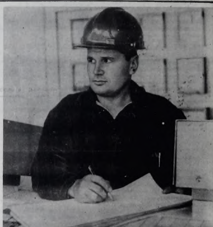
Подготовка к XXVI съезду КПСС приобрела всесоюзный характер. Она отмечается творческой инициативой и энергией масс, широким размахом социалистического соревнования. Многие коллективы Ангарска в честь предстоящего форума коммунистов приняли дополнительные обязательства, в среде них завод гидроразрыва объединения «Ангарскнефтеоргсинтез», где решено задание первых двух месяцев 1981 года выполнять на 102 процента, а день открытия съезда всем цехам отработать на сверхплановых сверхресурсах.

Обо всем этом говорили коммунисты на состоявшемся накануне партийном собрании, где отчитывался секретарь парторганизации телеателье А. Ф. Зырянов. Новым секретарем избран А. К. Колесников. Ю. ЖУКОВ.