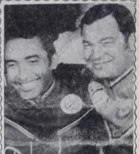
ПОЛЕТ МЕЖДУНАРОДНОГО ЭКИПАЖА ЗАВЕРШЕН