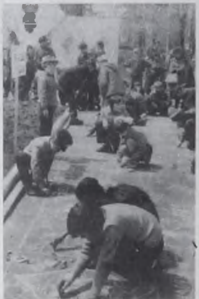
мир, за счастливое детство детей.