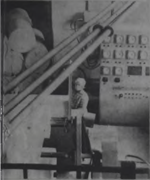
на заводе строительных материалов.

чек реакционного оборудования потребовалось бы для этого прироста построить дополнительно технологическую ятку общей стоимостью 10 — 12 млн. рублей. На комбинате же затрачено будет только 3 млн. рублей.