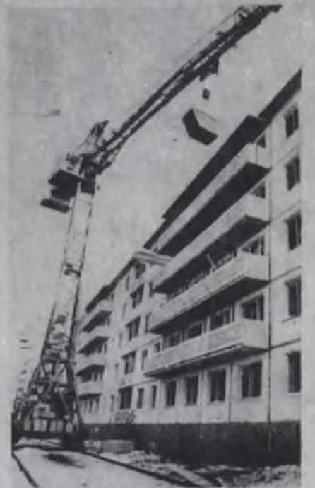
С каждым днем выше растут этажи нашего города.