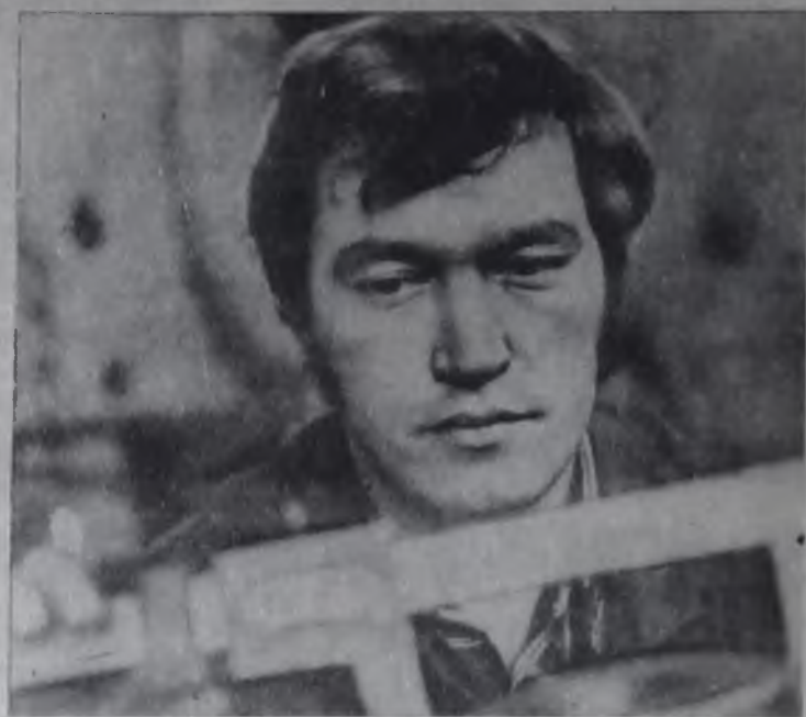
КОЛЛЕКТИВ механического цеха № 1 один из передовых на РМЗ объединения «Ангарскнефтеоргсинтез». Встав на трудовую вахту в честь 110-й годовщины со дня рождения В. И. Ленина, цех успешно выполняет взятые обязательства.

Совет должен своевременно информировать городской комитет народного контроля о наиболее важных проверках, периодически (раз в месяц) отчитываться перед городским комитетом, вносить предложения для рассмотрения тех или иных вопросов.