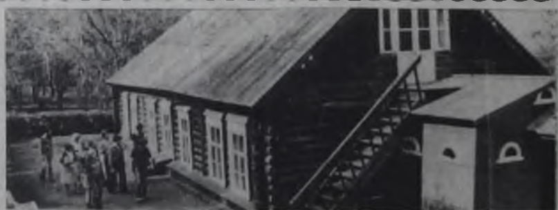
Татарская АССР. Село Ленино-Кокушкино известно тем, что сюда за участие в революционном движении студентов Казанского университета в декабре 1887 года был сослан молодой Владимир Ульянов.

На снимке: дом, в котором Владимир Ульянов жил во время ссылки.