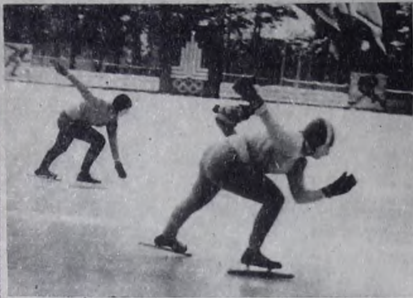
На снимке: на дистанция.

На минувшей неделе на ледовых дорожках стадиона «Ермак» прошло первенство города по конькобежному спорту среди спортклубов в зачет зимней спартакиады. Первое место в этих соревнованиях завоевали конькобежцы спортивного клуба «Ангара».