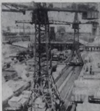
Для строек города.

За год сдали нормы ГТО 26800 человек, подготовлено