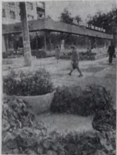
На улице Чайковского.