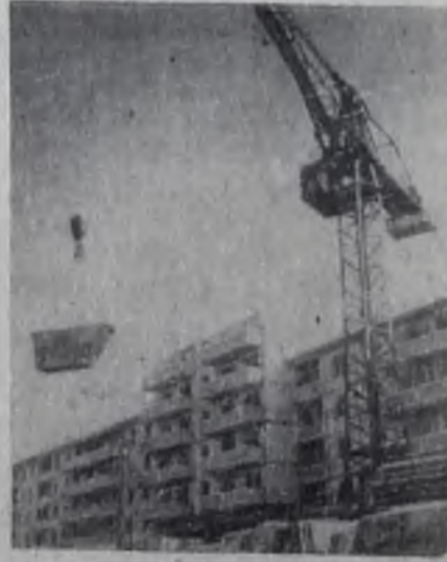
В 15-м микрорайоне.

рашаясь непосредственно к тем, кто занят в отраслях промышленности, производящих товары народного потребления, кто работает в торговле, общественном питании, сфере обслуживания, тов. Л. И. Брежнев говорил: «Товарищи, от вас, от вашего труда во многом зависит и благосостояние и настроение советских людей. Помните об этом. Работайте лучше и инициативнее, равняйтесь на передовиков. К этому призывает вас, этого ждет от вас партия».